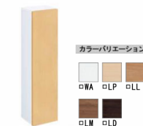
アンダーキャビネット TSF-102U/WA