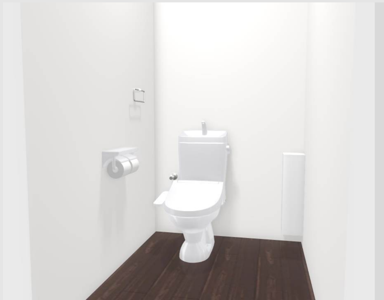
3DCGによるイメージ画像です。 反対壁に設置されている商品がある場合は表示されておりません。