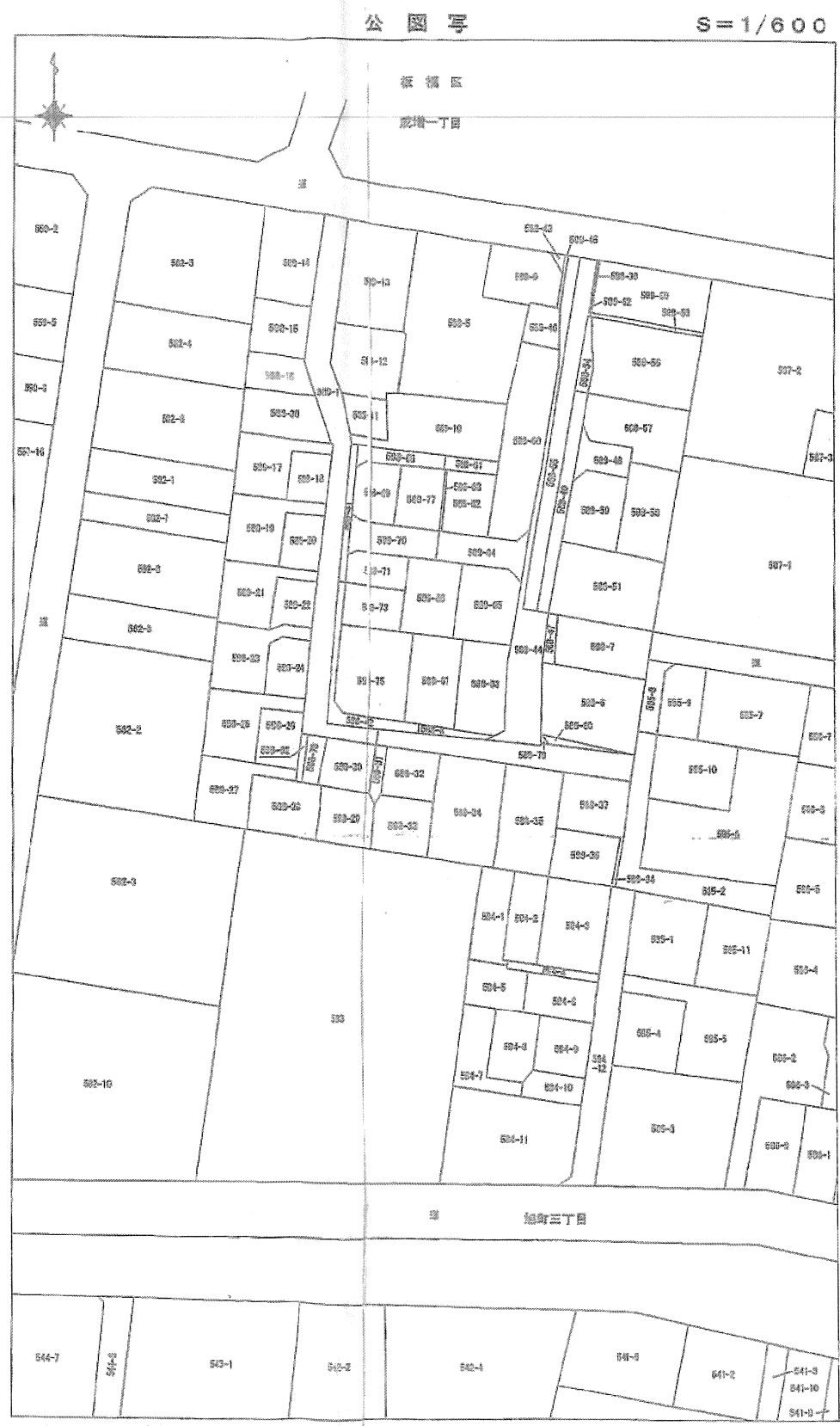
この図は区が建築確認時の参考とするため作成した測量図の写しです。

※現況や公図等を参考にした図面のため、土地所有者間の協議によっては線形が変更になる可能性があります。そのため、この図面の道路境界は、所有権境を特定するものではありません。