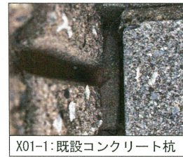
X01-1: 既設コンクリート杭