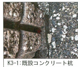
K3-1: 既設コンクリート杭